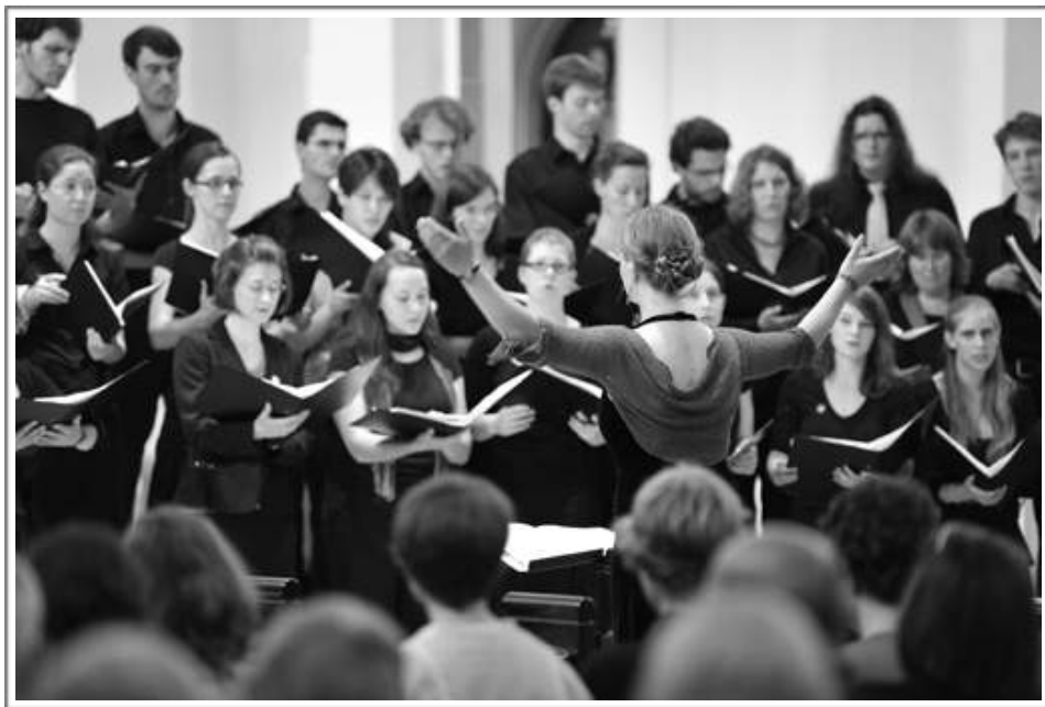
Neomania Ensemble Freiburg